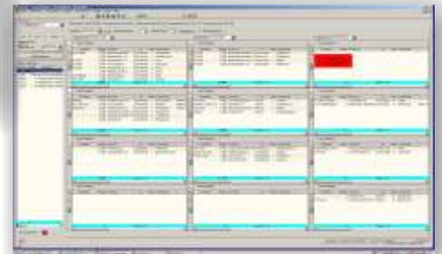
Definition von Liefergebieten:

Disponieren Sie Ihre Aufträge und planen Sie die Touren evtl. mit grafische Unterstützung